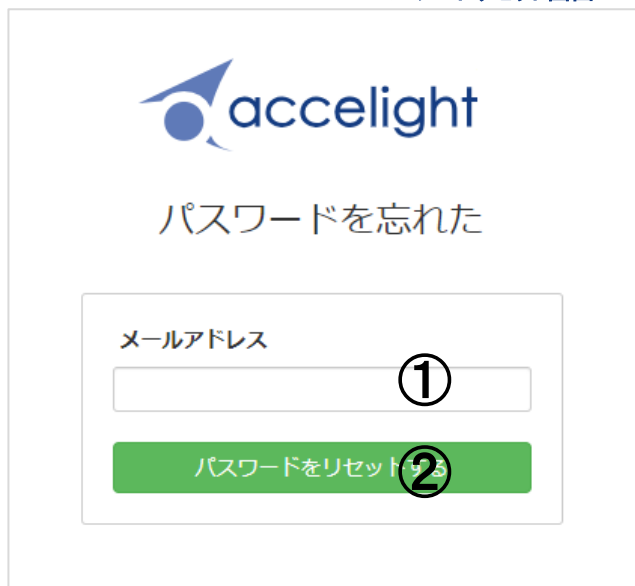
パスワードリセット画面

ログイン画面の『パスワードを忘れた?』リンクをクリックすると、以下のパスワードのリセット画面に遷移します。